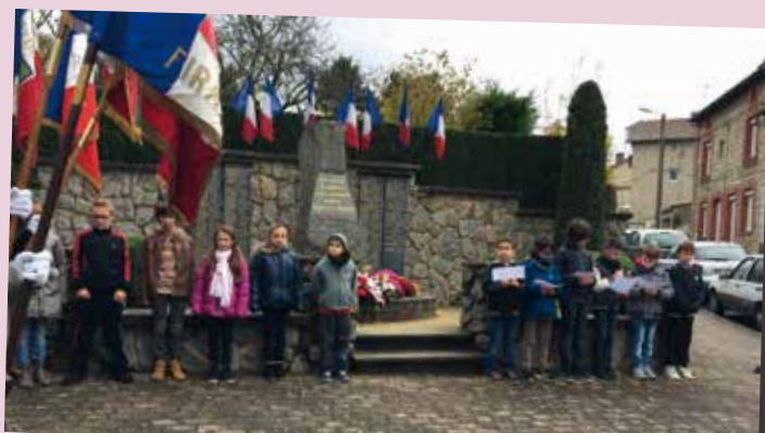
Le CME participe chaque année aux grands rendez-vous de la ville, comme les inaugurations ou commémorations (11 novembre, 8 mai...).