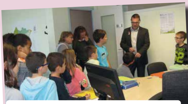
Les membres du CME sont amenés à visiter la mairie et rencontrer les services afin de découvrir son organisation.

Les élus du CME, à l'instar des Conseillers municipaux, participent régulièrement aux événements officiels et festivités de la commune. C'est notamment le cas lors des vœux du Maire, des commémorations du 8 mai et du 11 novembre où ils sont amenés à prendre la parole ou encore lors de manifestations comme la semaine du développement durable à laquelle ils ont contribué en fabriquant des caisses à savon avec lesquelles ils ont défilé de la Place du Vigneron jusqu'au parc Nelson Mandela.