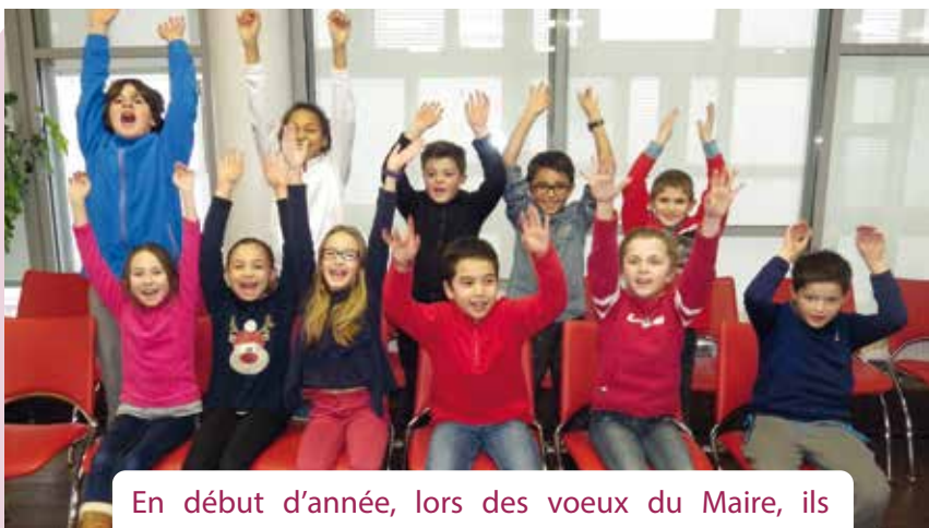
En début d'année, lors des vœux du Maire, ils adressent leurs vœux à travers une vidéo retraçant l'année écoulée.