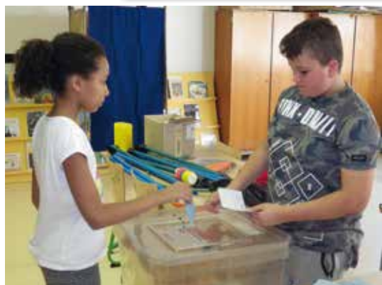
Elections à l'école du Val Ronzière

Une fois élus, les Conseillers Municipaux Enfants sont les représentants des enfants d'Unieux. Ils sont à leur écoute et participent à la vie de la commune. Dans chaque école, les élèves peuvent s'adresser aux Conseillers pour leur faire part de leurs demandes, remarques ou questions. Une boîte à idée est également disponible. La durée de leur mandat est de 2 ans. Le Conseil est renouvelé chaque année en septembre par moitié.