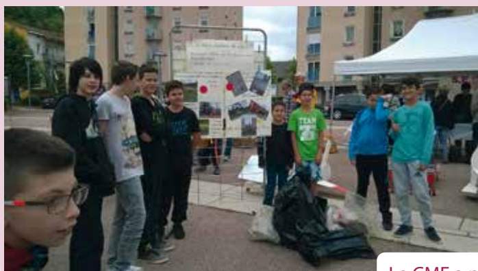
Le CME a participé à la semaine de l'environnement !