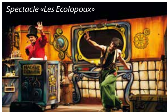
Spectacle «Les Ecolopoux»

Tous les enfants sont attendus salle André Chauvy, mercredi 22 février à 14h pour confectionner Wall E , le Monsieur Carnaval 2017 qui sera ensuite exposé à la médiathèque en attendant le carnaval du 10 mars !