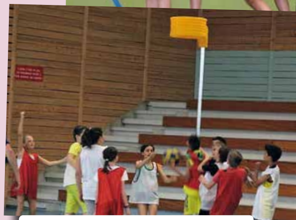
Tournoi inter CM2 de Korfball